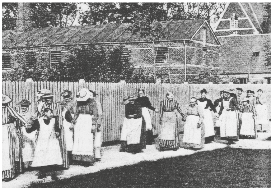
Kvindelige asylister fra Karens Minde på gåtur 1895. Illustreret tidende nr. 6, årg. 37.

ældrenes status som gifte eller ikke gifte, ville "Fremtidens Sædelighed" sondre mellem sundt og usundt afkom. Det kristne samfund var ifølge Key gået for vidt m.h.t. medlidenhed over for svagt og usundt afkom, som der blev holdt liv i på trods af al naturvidenskabelig fornuft: "Medens det hedenske Samfund i sin Haardhed aflivede de svage og forkrøblede Børn, er det kristne Samfund i sin "Medlidenhed" gaaet saa vidt, at det forlænger Livet for det fysisk og psykisk uhelbredeligt syge, ja selv for det til det yderste vanskabte Barn – til en stedsevarende Plage for Barnet selv og dets Omgivelser", skriver Ellen Key. 23 Det var "de uhelbredeligt syge børn" som dem på Karens Minde, Ellen Key tænkte på.