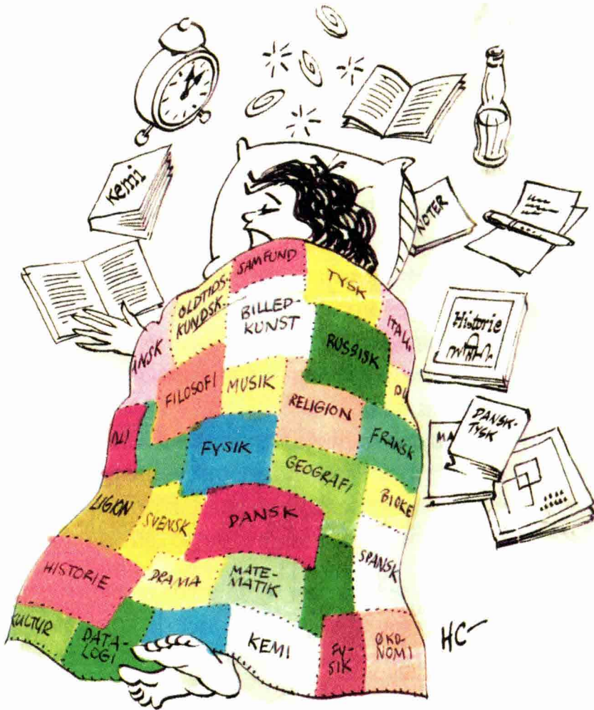
Det faglige kludetæppe 1988. Eleven ligger måske og fordøjer de mange fags almene dele og er i så fald i færd med at blive almindannet (HC-tegning i Haue, Almindannelse som ledestjerne , s. 500).

vigsk inspireret forestilling, der snart viste sig som ude af trit med bl.a. Socialdemokratiets ønske om en dynamisk samfundsudvikling. 41