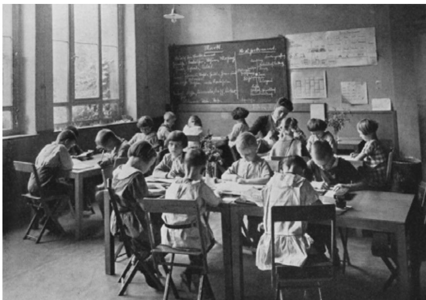
Den tyske pædagog Peter Petersen blev besøgt af mange danske lærere og pædagoger for at se, hvordan hans reformpædagogiske Jenaplan fungerede. På billedet ses gruppearbejde i en skole ordnet efter Jenaplanen 1927.

kopiere/omsætte udenlandske skolepolitikker eller -praksisser i en hjemlig kontekst, det være sig tyske arbejdsskoler eller svenske ungdomsskoler. For langt hovedparten af bevillingerne var der derimod tale om en almindelig rejse med kultur, sprog og undervisning i centrum, bl.a. feriekurser. Indtryk og oplevelser fra besøgene findes i rejseberetningerne, som fortæller, hvad lærere og lærerinder lagde vægt på at rapportere hjem, og hvordan lærere og lærerinder forstod de udenlandske praksisser.