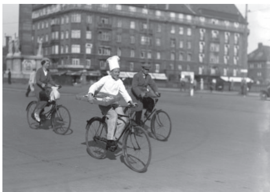
En bagerlærling på vej ud med brød og kager, Vesterbrogade i 1930'ernes København.