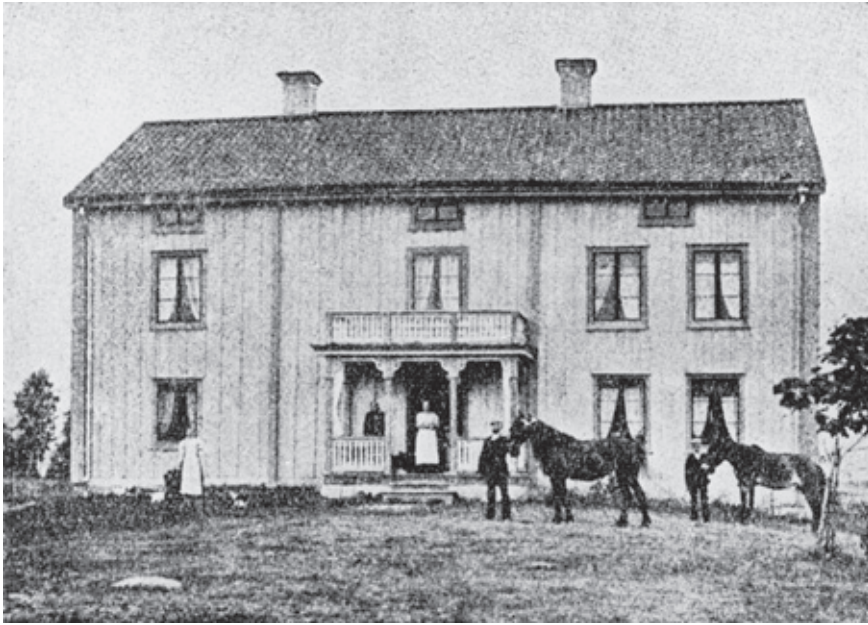
Nävsta skola (Selånger) färdigställdes 1848, sex år efter folkskolestadgan.

ten vände sig till kyrkkassor, sockenmagasinskassor och privatpersoner, och tog banklån från exempelvis Sundsvalls sparbank och Kredit Aktiebolaget Sundsvall. Skolväsendet framstår därmed, på samma sätt som den svenska industriella revolutionen, som beroende av 1800-talets expanderande kreditmarknad. 45